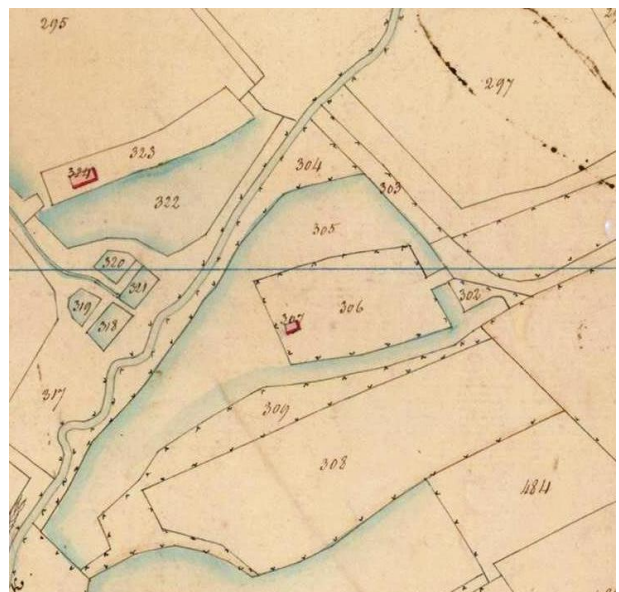
Kadasterplan 1841-1833 (toestand 1827)