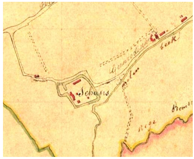
Kadasterplan (toestand 1827)