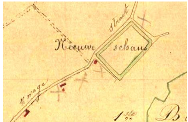
Kadasterplan (toestand 1827)