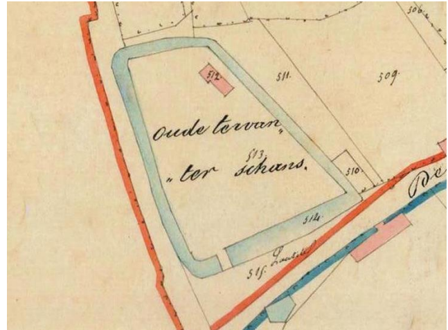
Kadasterplan (toestand 1827)