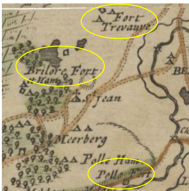
Fricx-kaart (1712) – Forten Trevauve (Tervant), Brilore (Brellaar) en Polle (Paal)