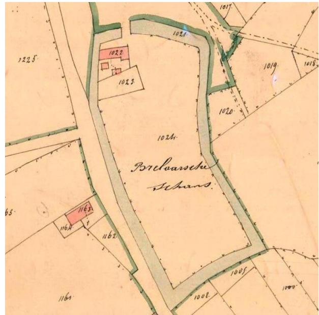
Kadasterplan (toestand 1827)