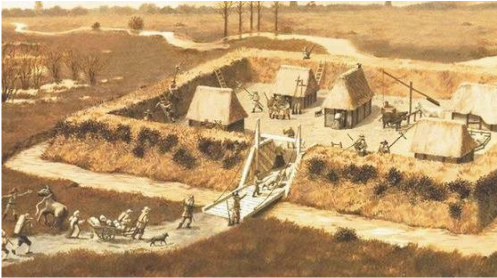
Boerschans tegen plunderende troepen