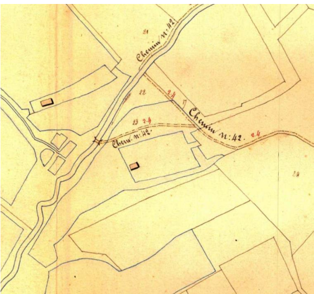
Atlas der Buurtwegen (1841)

Deze schans was gelegen ten westen van de stadskern aan de Zwarte beek, iets ten noorden van de huidige steenweg van Paal naar Beringen. Hij staat niet op de Ferraris-kaart en ook niet op de Capitaine/Chanlaire-kaart.