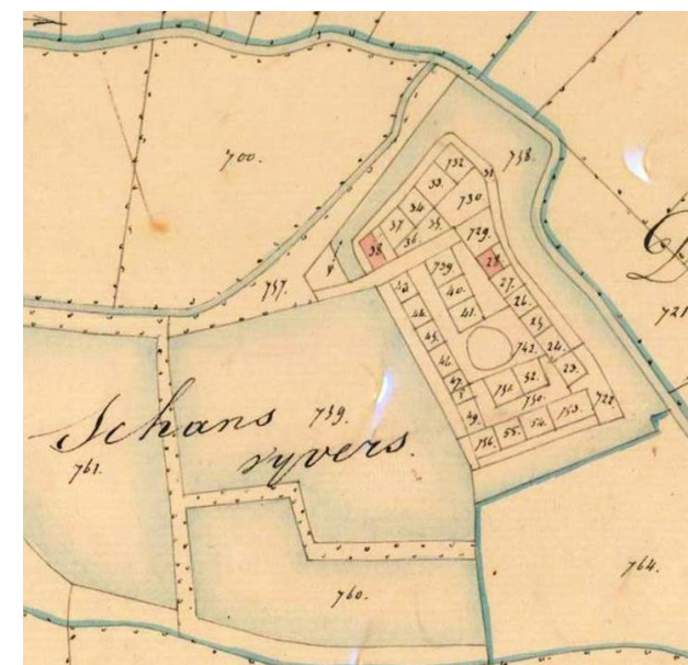
Kadasterplan (toestand 1827)